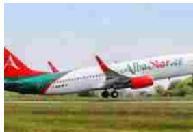
Trapani, agosto: +82% passeggeri in aeroporto