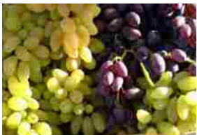
L'uva Pizzutello di Tivoli nuovo Presidio Slow Food