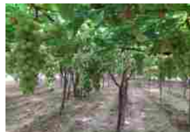
Puglia: Grottaglie, regina dell'uva da tavola